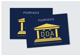
AUFKLEBER FÜR IHRE PRAXISRÄUME