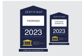
UNSER SIEGEL FÜR JEDES ZERTIFIKAT FÜR DIE DAUER DER GÜLTIGKEIT

Ab dem 1.1.2024 gibt es das Marketing-Paket dann auch für das DDA-Zertifikat „Patientensicherheit in der Dermatologie“ FÜR NUR 25,00 EURO